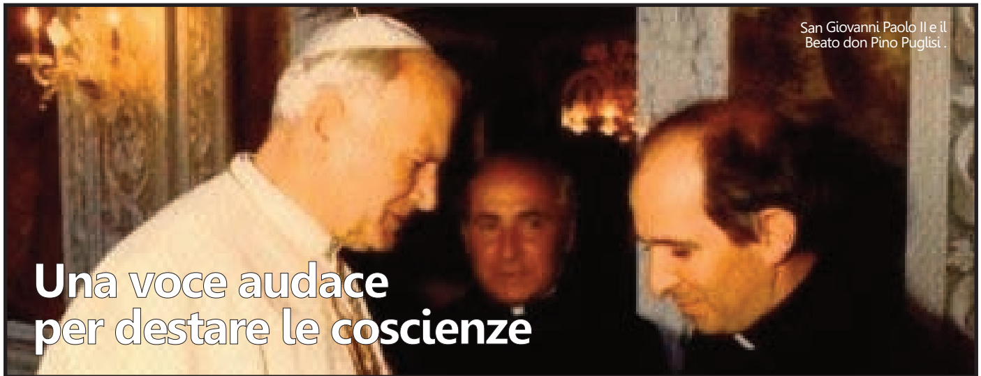
San Giovanni Paolo II e il Beato don Pino Puglisi.