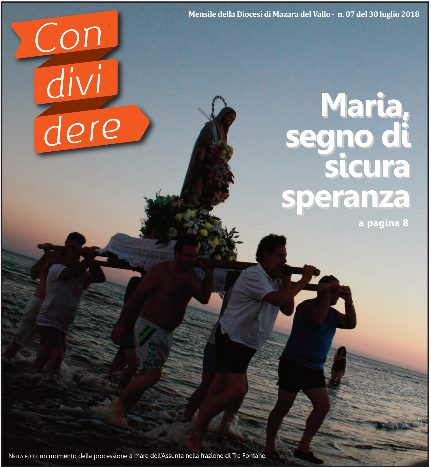
NELLA FOTO: un momento della processione a mare dell'Assunta nella frazione di Tre Fontane.