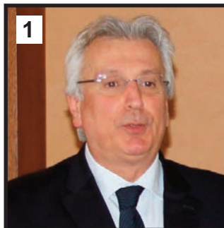
In queste sei foto i deputati regionali eletti nella provincia di Trapani.