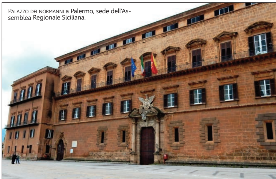
PALAZZO DEI NORMANNI a Palermo, sede dell'Assemblea Regionale Siciliana.

Ridare credibilità alla politica, esigere onestà negli eletti