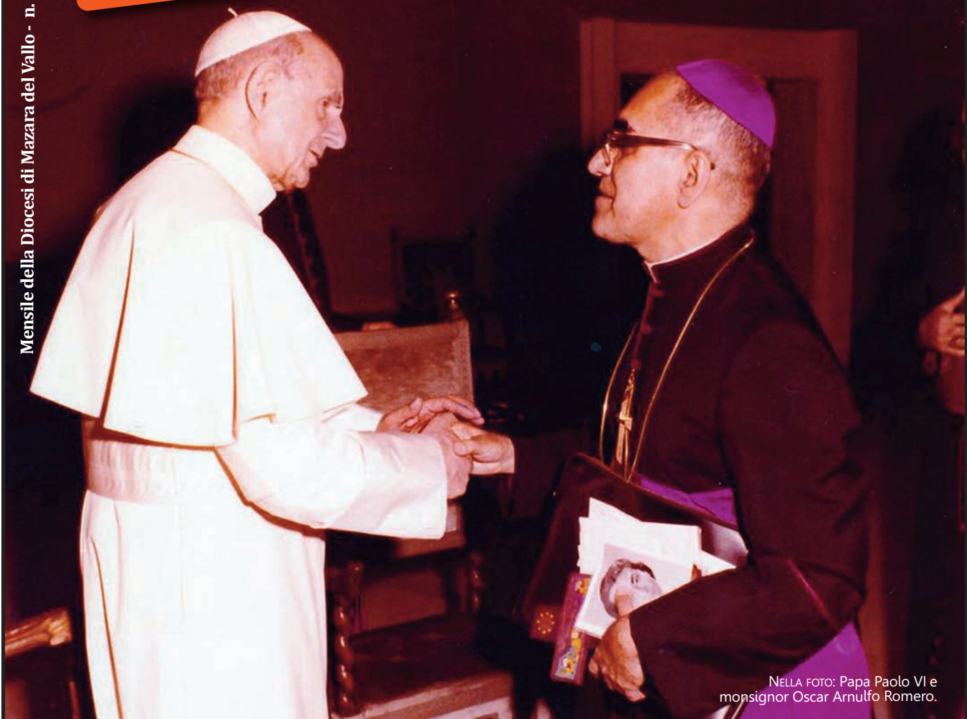
NELLA FOTO: Papa Paolo VI e monsignor Oscar Arnulfo Romero.

Mensile della Diocesi di Mazara del Vallo - n. 09 del 29 ottobre 2018