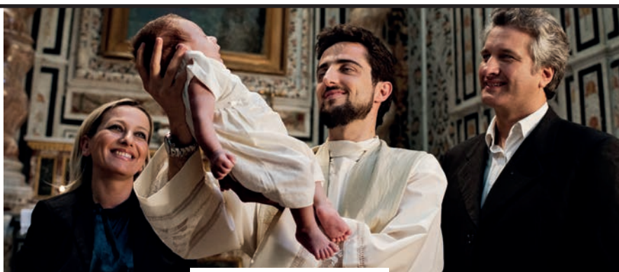
CON LE FAMIGLIE

Segui la missione dei sacerdoti su www.facebook.com/insiemeaisacerdoti