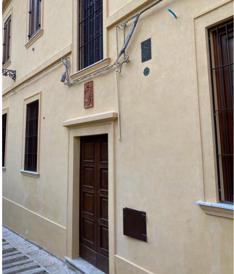
La facciata della casa canonica dopo l'intervento di ristrutturazione.